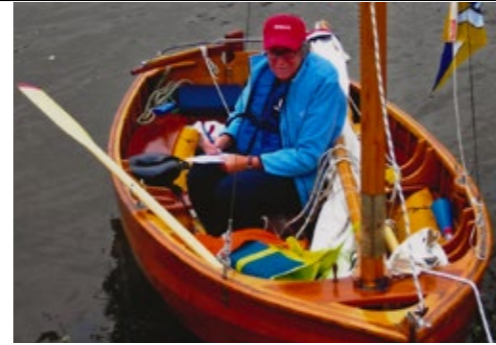
MARLIEN IS KLAAR VOOR DE TOERTOCHT

We zeilen nog steeds met veel plezier in de nu bijna 100-jarige jol (1929). Nee, geen wedstrijden, maar lekker toerzeilen door de Kalverstraat en met 'Natuurlijk Varen' (van Deventer naar Giethoorn en van Leeuwarden naar Garnwerd aan het Reitdiep) en zoveel mogelijk andere toertochten. Wij hebben altijd roeiriemen en een anker aan boord. Ook is er ruimte voor een elektrisch pompje dat kan worden ingezet. Als toerzeiler kunnen we ons meer vrijheden permitteren. Toch voldoen we aan alle eisen om een geldige meetbrief te behouden.